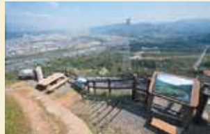
慈尊院から展望台まで約30分です。高野の山並みが望めます。

九度山駅～壇上加藍 歩行距離…20.9km 標準歩行時間…約6時間20分 標準所要時間…休憩などを含め約10~11時間